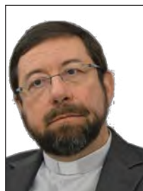
† Jean-Pierre DELVILLE, évêque de Liège