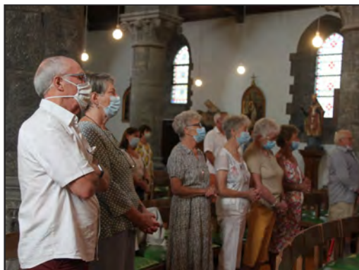
Pèlerinage du 14 août (Texte pages 19)